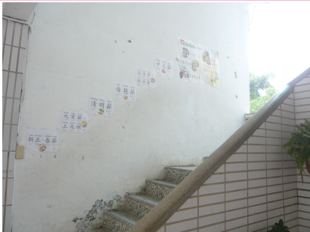
配合母語日在樓梯轉角布置母語情境