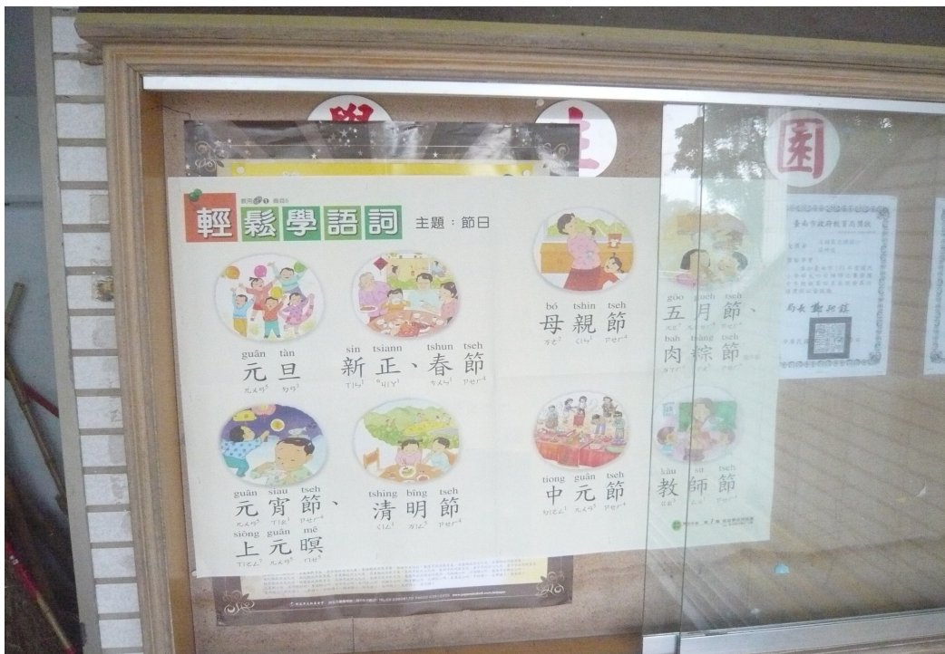
利用公布欄佈置母語情境