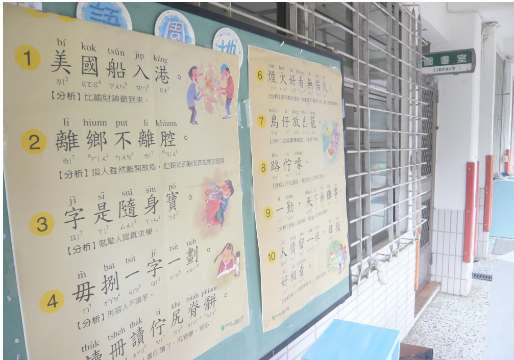
利用電腦教室外公布欄佈置母語日每週俗諺