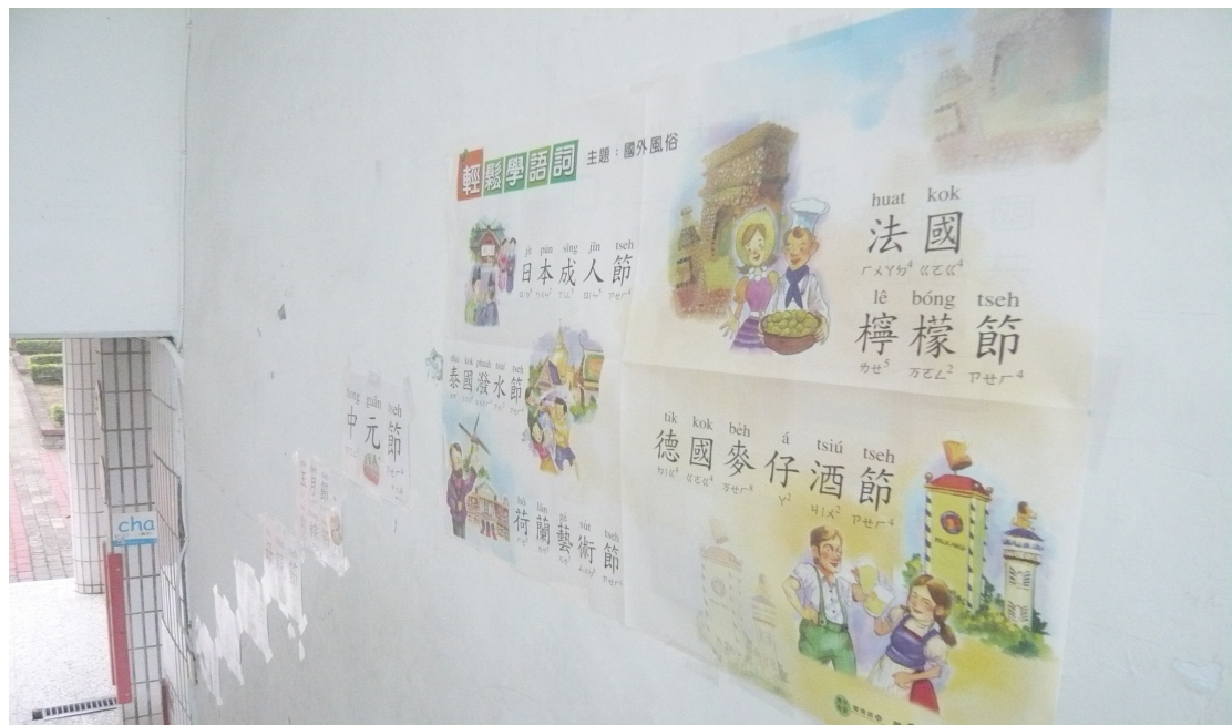
配合母語日在樓梯轉角布置母語情境